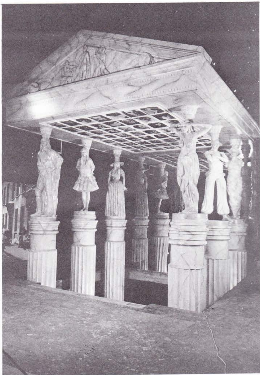
△設計以希臘神殿為基，以國際影星像為柱，天花板貼滿著名影星照，象徵了電影博物館的恢宏神聖